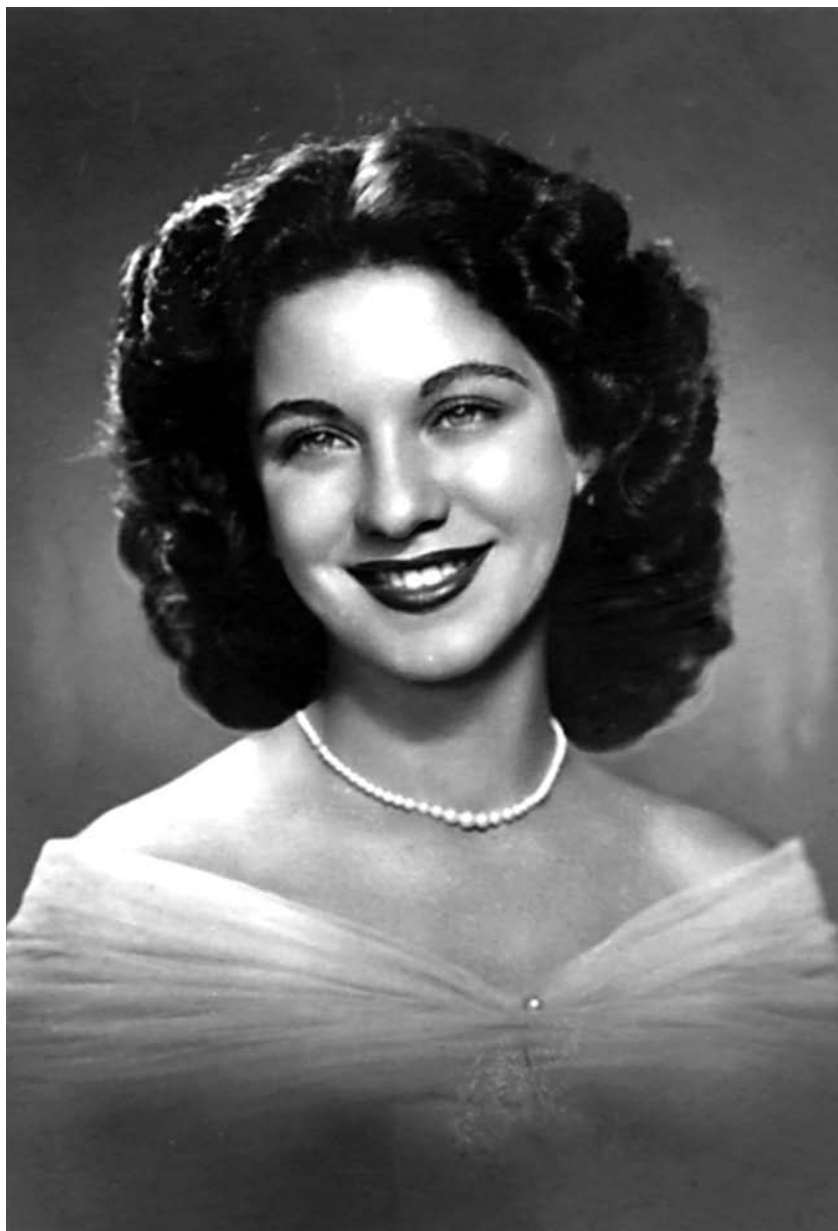
Retrato tirado em 1950 para o álbum de formatura do conservatório