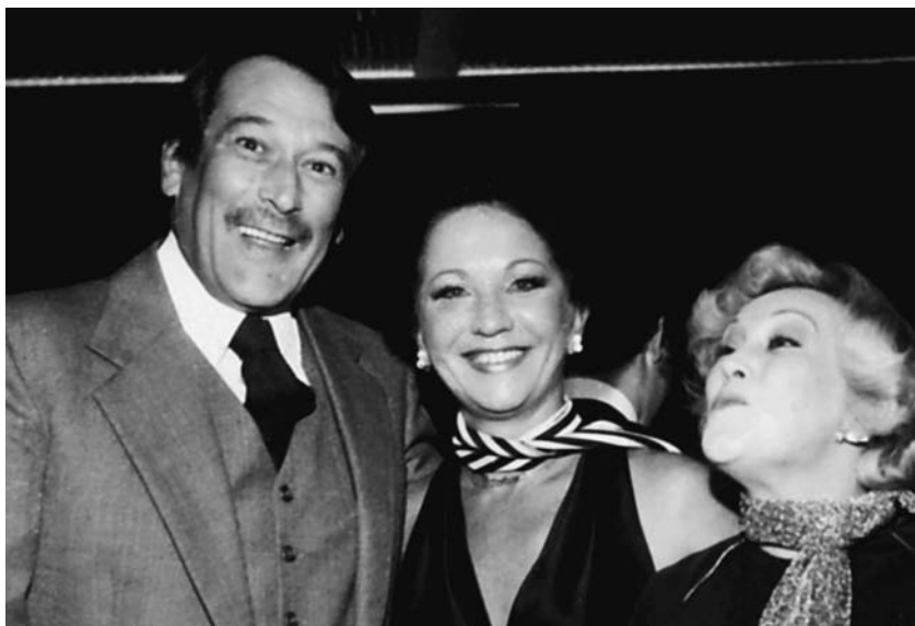
Paulo Goulart e Nicette Bruno: amigos de palco e de bastidores