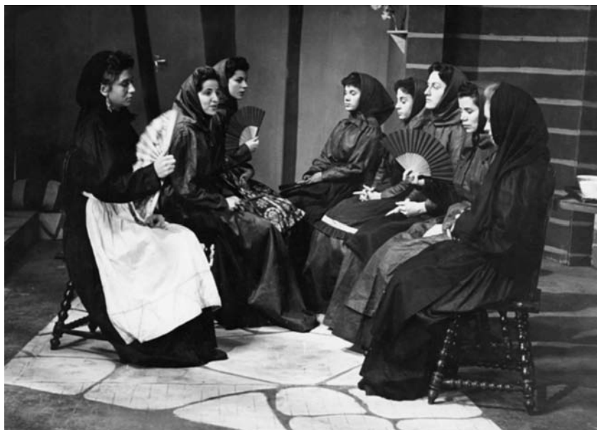
Lolita em A Casa de Bernarda Alba, TV Tupi