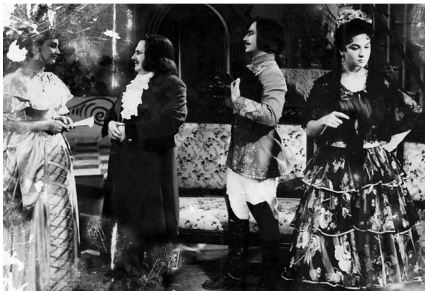
Laura Cardoso, Jaime Barcellos, Lima Duarte e Lolita em O Chapéu de Três Bicos