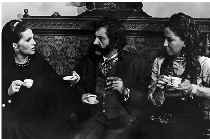
Amália Rodrigues, Rolando Boldrin e Lolita em Os Deuses Estão Mortos, na TV Record