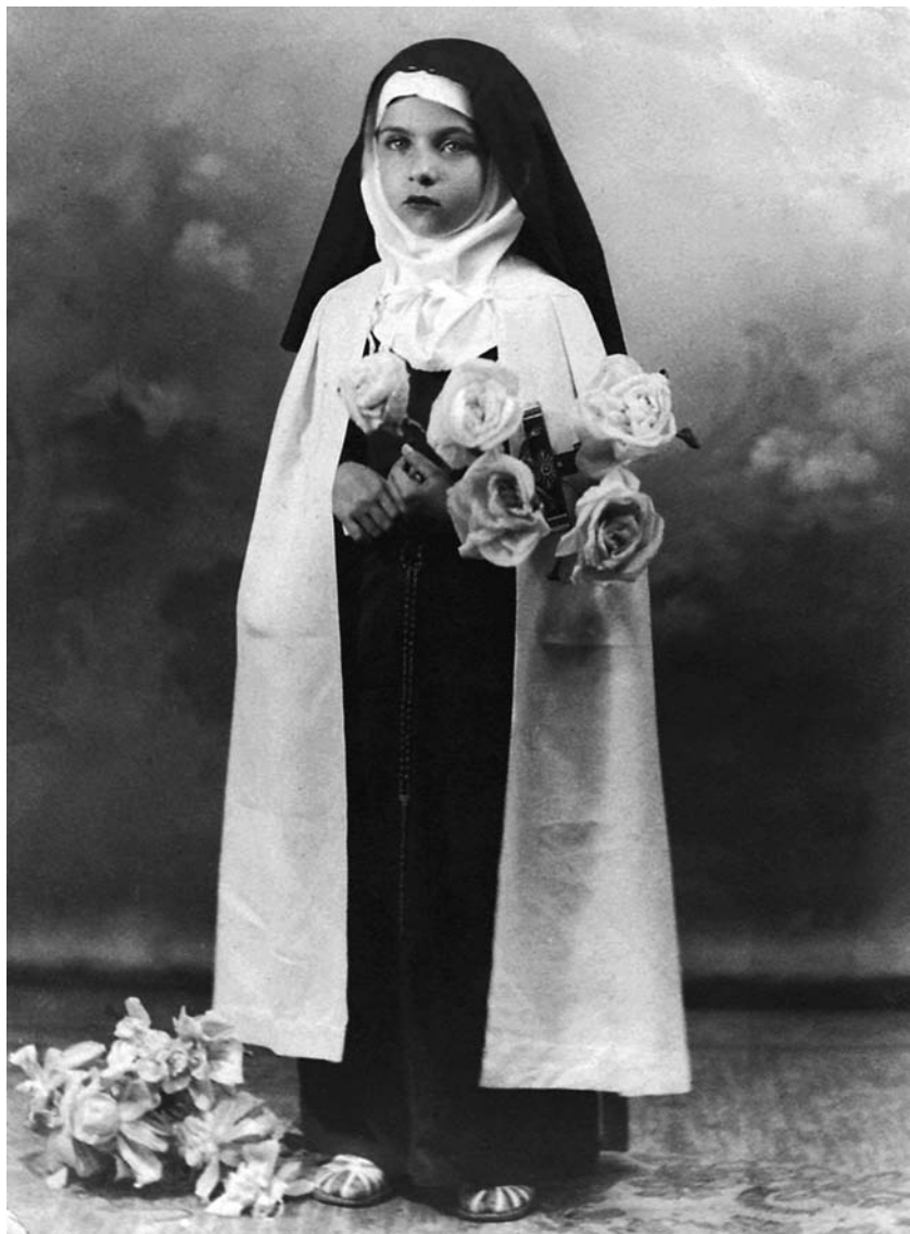
Aos seis anos, vestida de Santa Terezinha, para sair em procissão e pagar promessa