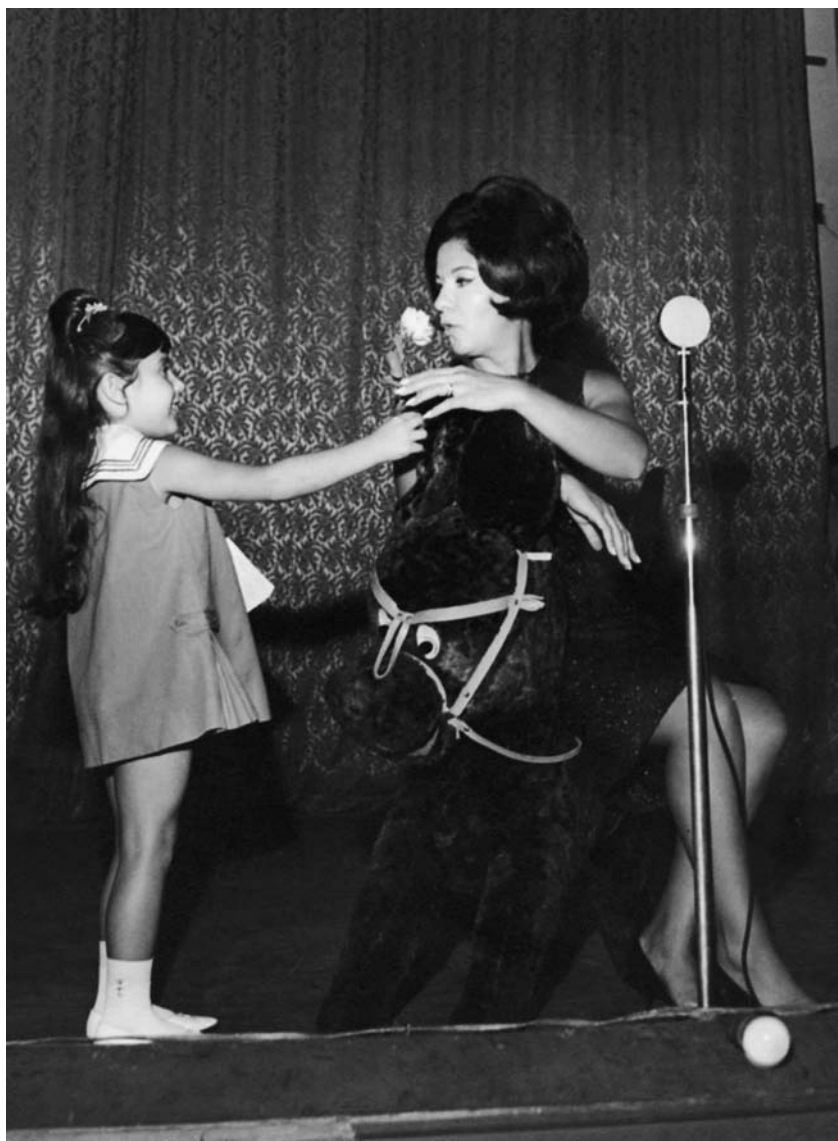
Em 1960, Lolita em programa infantil da TV Cultura, afiliada da TV Tupi