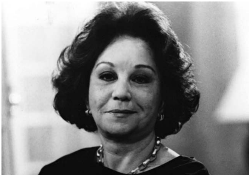
Na novela A Viagem, 1994, na Globo

Envelhecer na TV não é fácil. Os papéis vão rareando. Antes de ser convidada para fazer a novela Terra Nostra , estava esquecida. A Globo não me chamava para nada havia cinco anos. Meu trabalho anterior tinha sido A Viagem , em 94. Estava me sentindo a mosca do cocô do cavalo do bandido. Quando começou a novela, achei a história criada pelo Benedito Ruy Barbosa maravilhosa. Adorei o trabalho dos artistas. Tudo muito bem cuidado, com a mão de ouro do Jayme Monjardim. Por isso, durante três meses, assistia religiosamente àquela novela. Não perdi um só capítulo, uma só cena. Isso fez com que eu desejasse muito voltar a fazer novela.