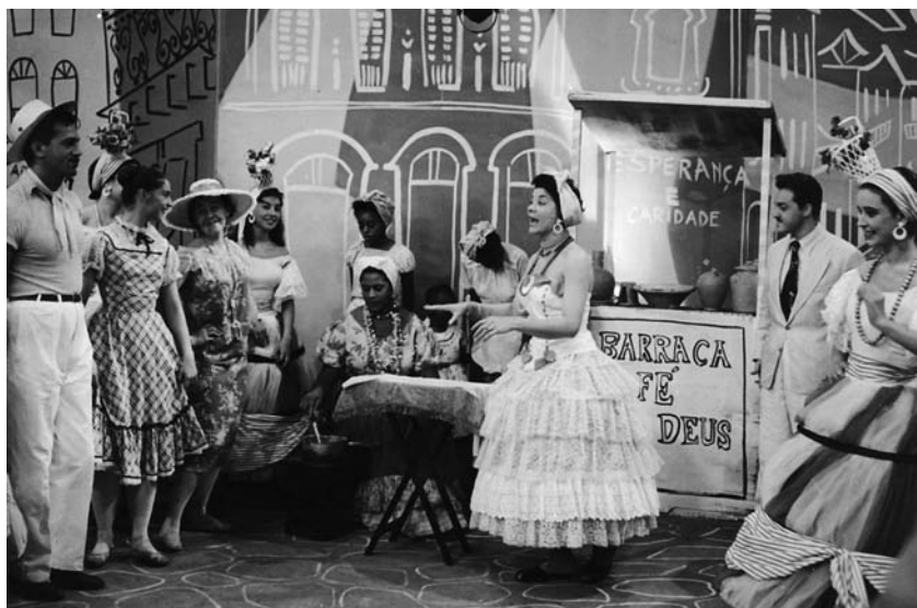
Cantando No Tabuleiro da Baiana, em número musical do programa Folias Philips