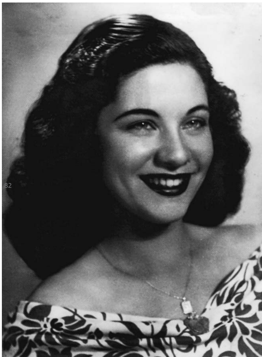
Com 19 anos, em fotografia feita para fãs