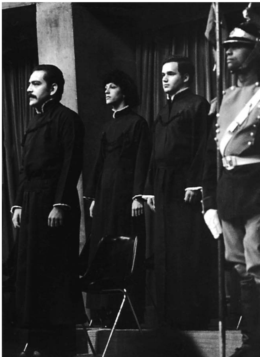
Minha filha, durante a formatura do curso de Medicina