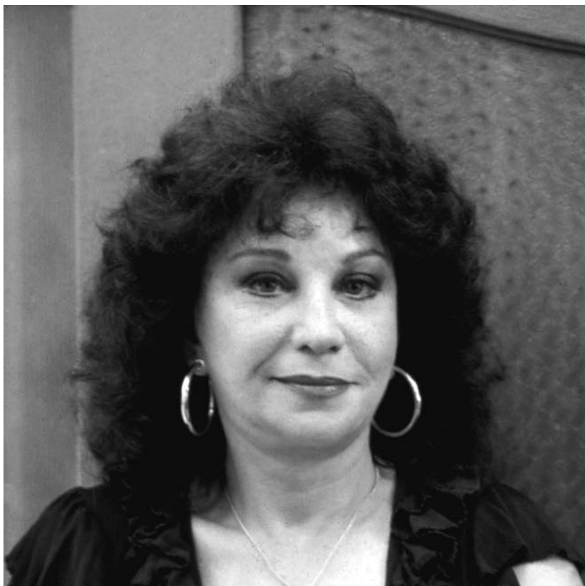
Lolita na novela Sassaricando, da Globo, 1987

Meu primeiro beijo na boca – técnico, é claro – em novela foi dado no Carlos Zara, em Sassaricando . O Zara era um amigo de muitos e muitos anos e aí me senti à vontade para fazer a cena. Foi um caso especial porque havia aquela confiança e intimidade que só existe entre amigos de verdade.