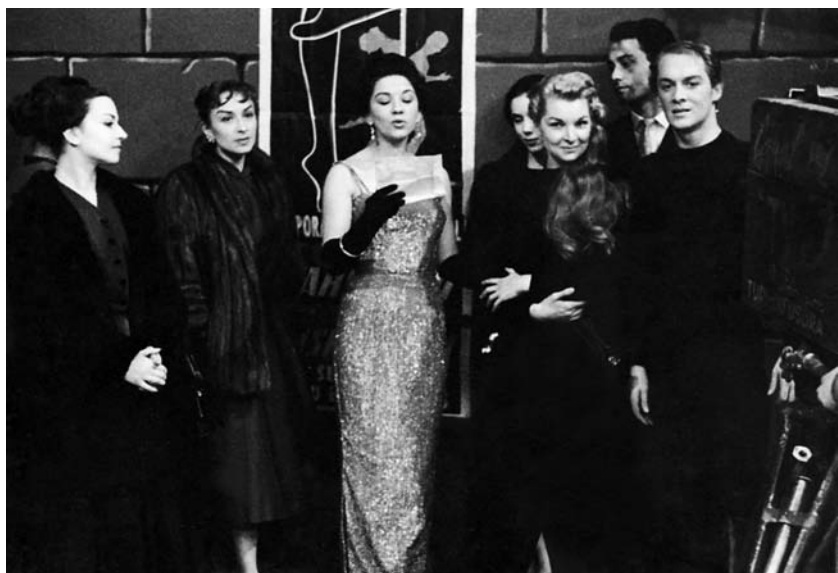
No programa Música e Fantasia, quando recebeu Zizi Jeanmaire (de cabelo louro comprido)