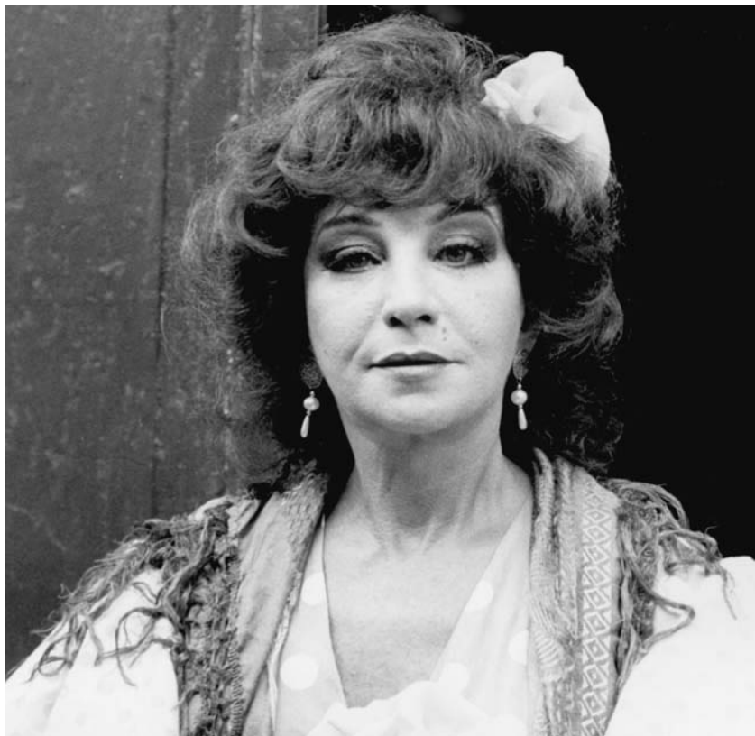
Na série Memórias de um Gigolô, Globo, 1986

se lamentar. É preciso encarar a vida como ela é. Aprendi com o tempo. Mas ainda não me considero uma mulher sábia. Apesar da minha idade e da minha experiência, tenho de confessar que, no fundo, me sinto uma garota. Eu não sei nada! Ainda tenho muito para aprender.