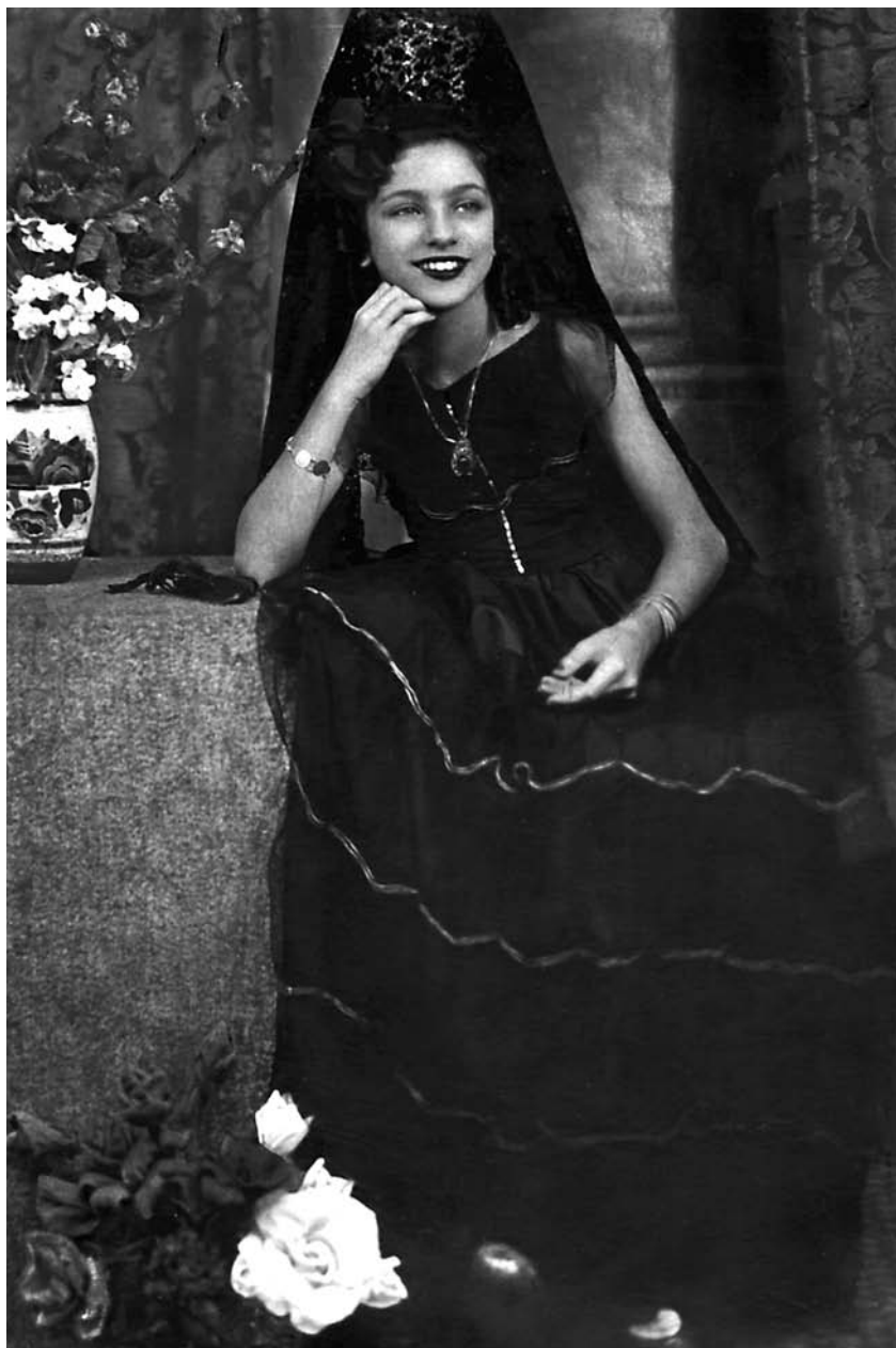
Aos 10 anos, como espanhola