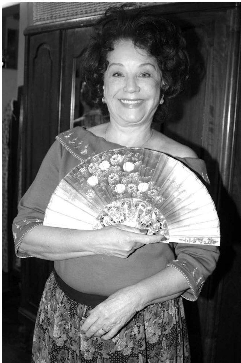
Na Novela Kubanacan, da Globo, em 2002