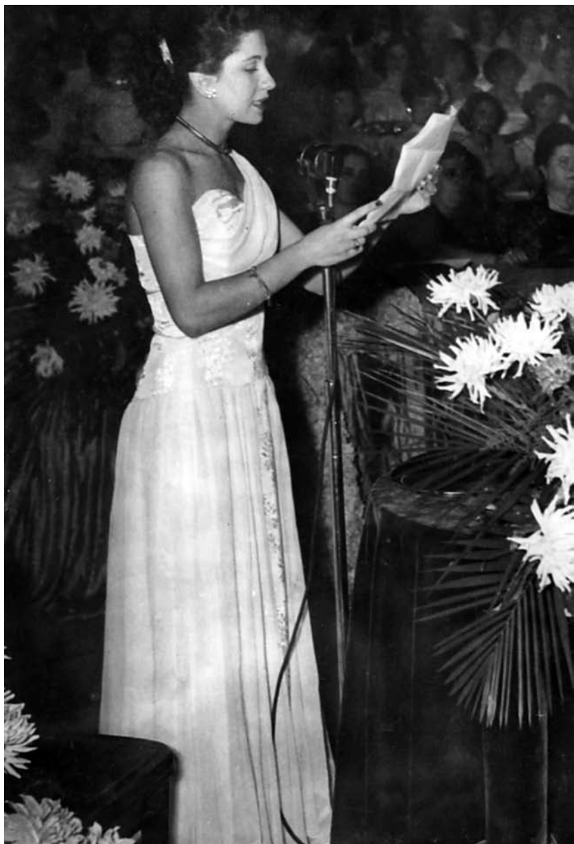
Oradora na formatura do Conservatório Dramático e Musical de São Paulo, 1950