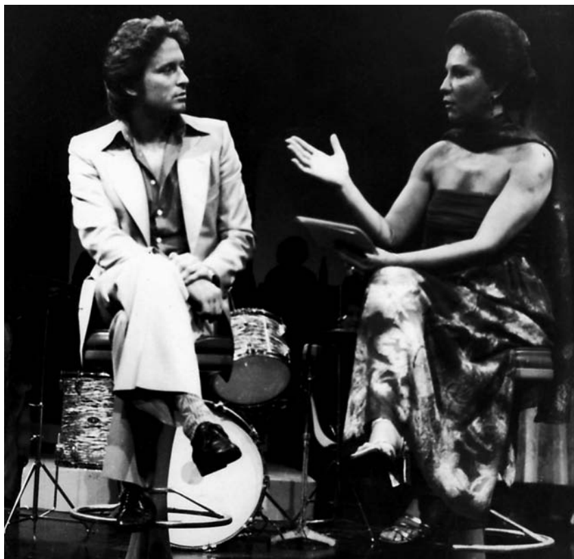
No Clube dos Artistas, com o ator Michael Douglas: Ele estava começando a fazer sucesso no seriado São Francisco Urgente, anos 70

após nossa conversa. Mas quando soube que o Jorge Ben [hoje Benjor] iria cantar, pegou uma cadeira, sentou-se e ficou ali, bem no meio do palco, ouvindo a apresentação do Jorge. Acredito que uma das coisas que ajudavam a fazer o sucesso do programa era isso: a gente deixava