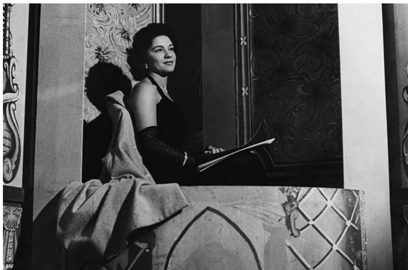
Em pausa de Os Irmãos Corsos, TV Tupi, 1966: Minha carreira não foi planejada, mas foi acontecendo aos poucos