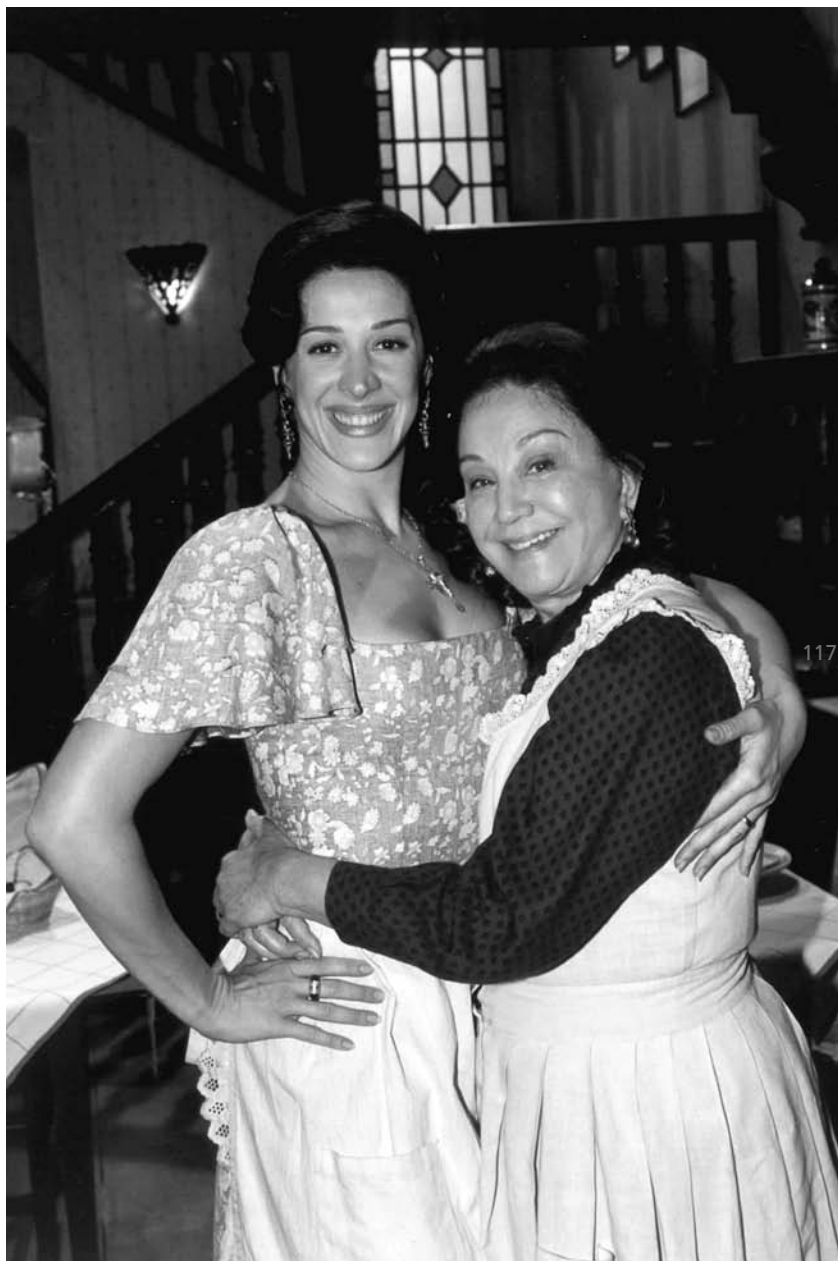
Novela Terra Nostra, com Cláudia Raia, na Globo, 2000