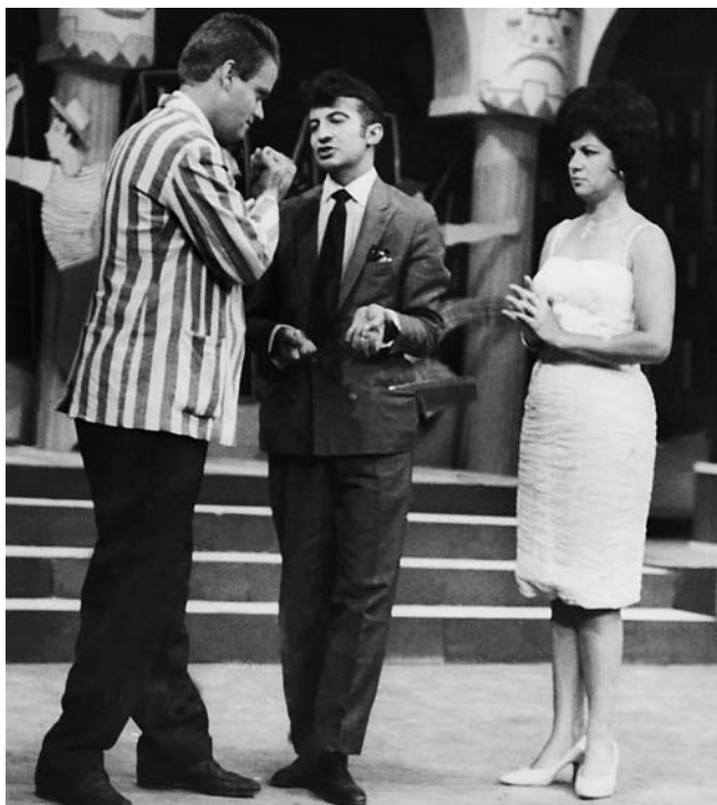
Lolita no programa Você Faz o Show, em Recife, com Odilon del Grande e Jorge Loredo, o Zé Bonitinho

Programa infantil patrocinado pela fábrica de brinquedos Estrela. Nele, a apresentadora Lolita