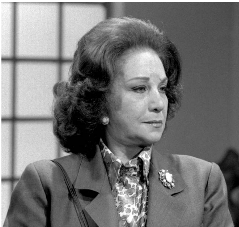
Em 1992, na novela Despedida de Solteiro, na Globo: Fazer a vilã me angustiava muito

até o momento única – experiência de fazer um personagem mau. Eu vivi a Emília, que era terrível. Foi um momento difícil para mim como atriz, porque eu saía do estúdio muito triste.