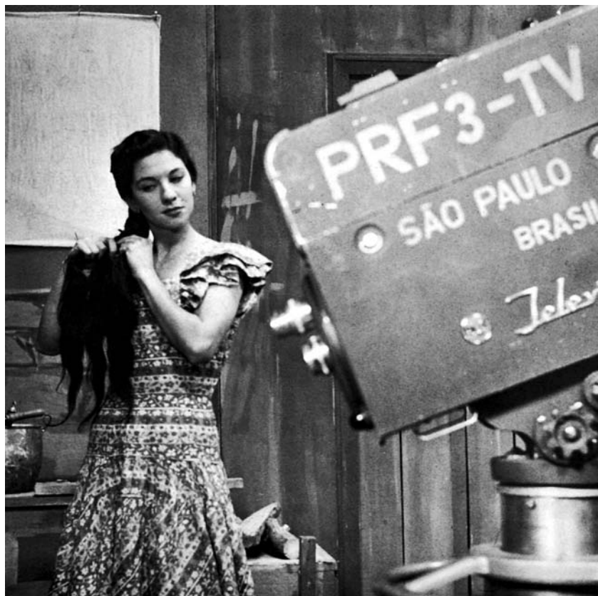
Em frente à câmera da PRF3-TV Difusora, Tupi