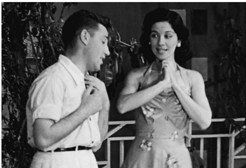
Lolita na opereta O Mano de Minas, TV Tupi