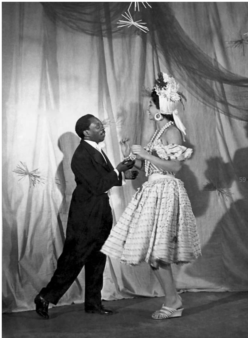
Grande Otelo e Lolita cantando Os Quindins da Iaiá, no Música e Fantasia: Fiquei emocionadíssima!