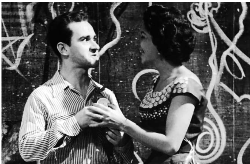
Ronald Golias e Lolita no programa Melhores da Semana