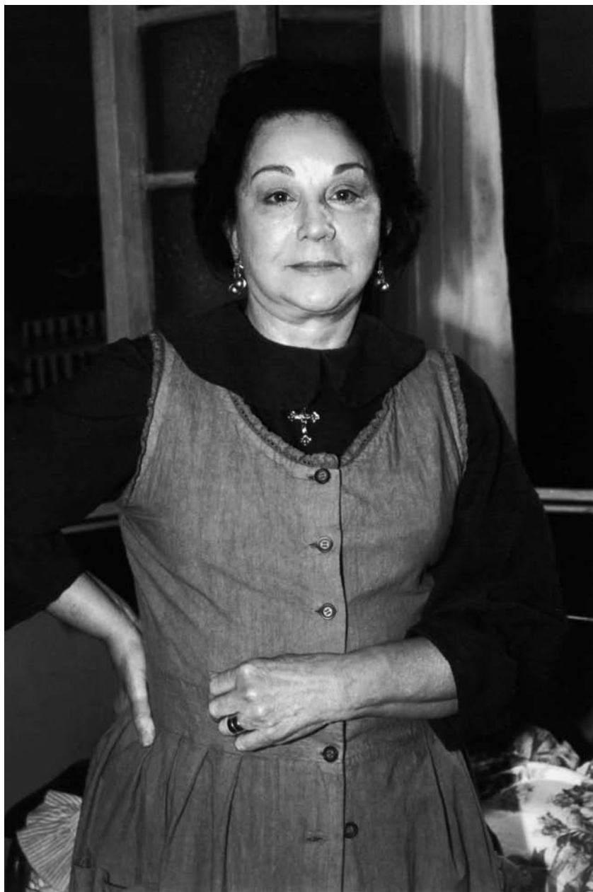
Novela Terra Nostra, da Globo, 2000