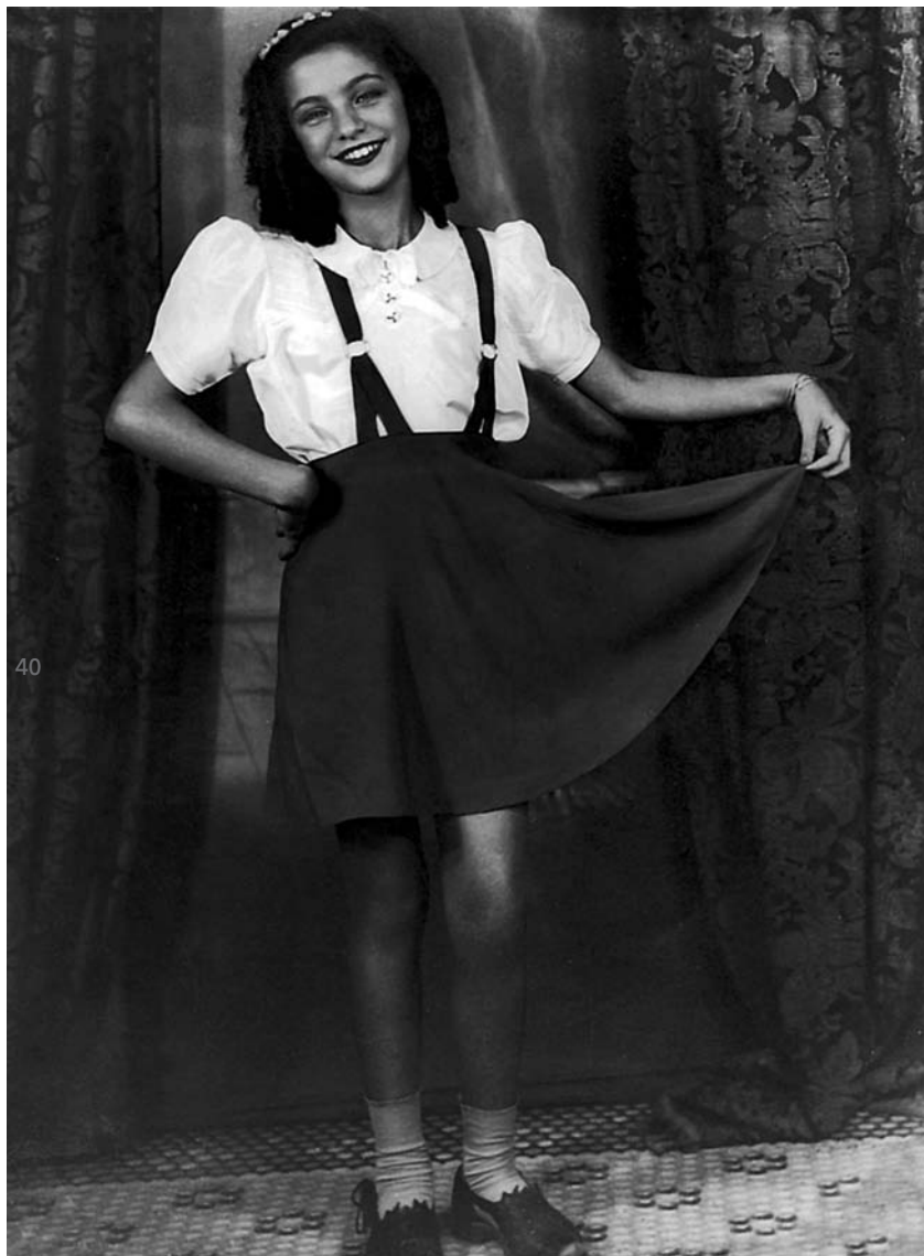
Estava pronta para uma apresentação de rádio. Eu tinha dez anos