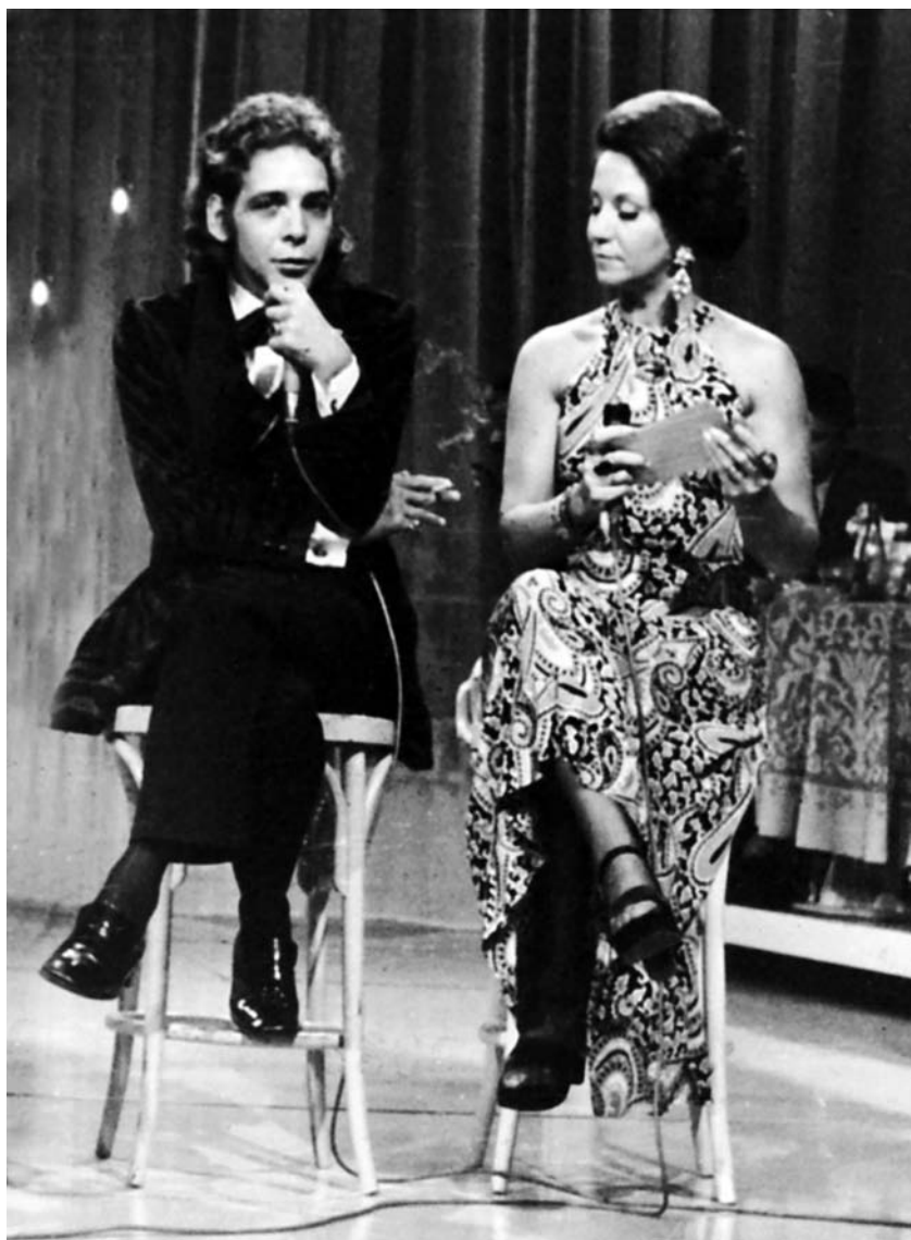
Entrevista com o costureiro Dener no Clube dos Artistas, 1970