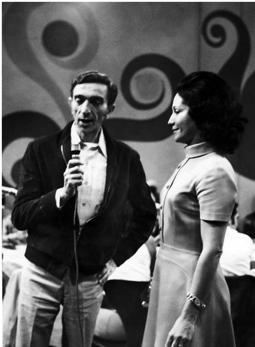
No 17º aniversário do Almoço com as Estrelas, recebendo homenagem do diretor Geraldo Vietri, 1973