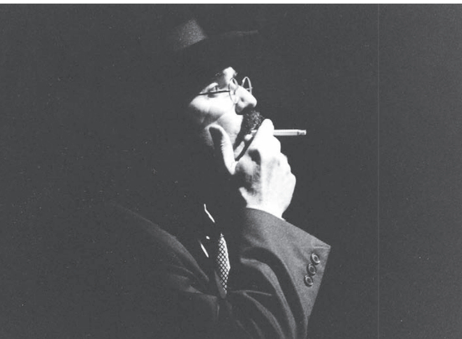
Helio Cicero em O Fingidor